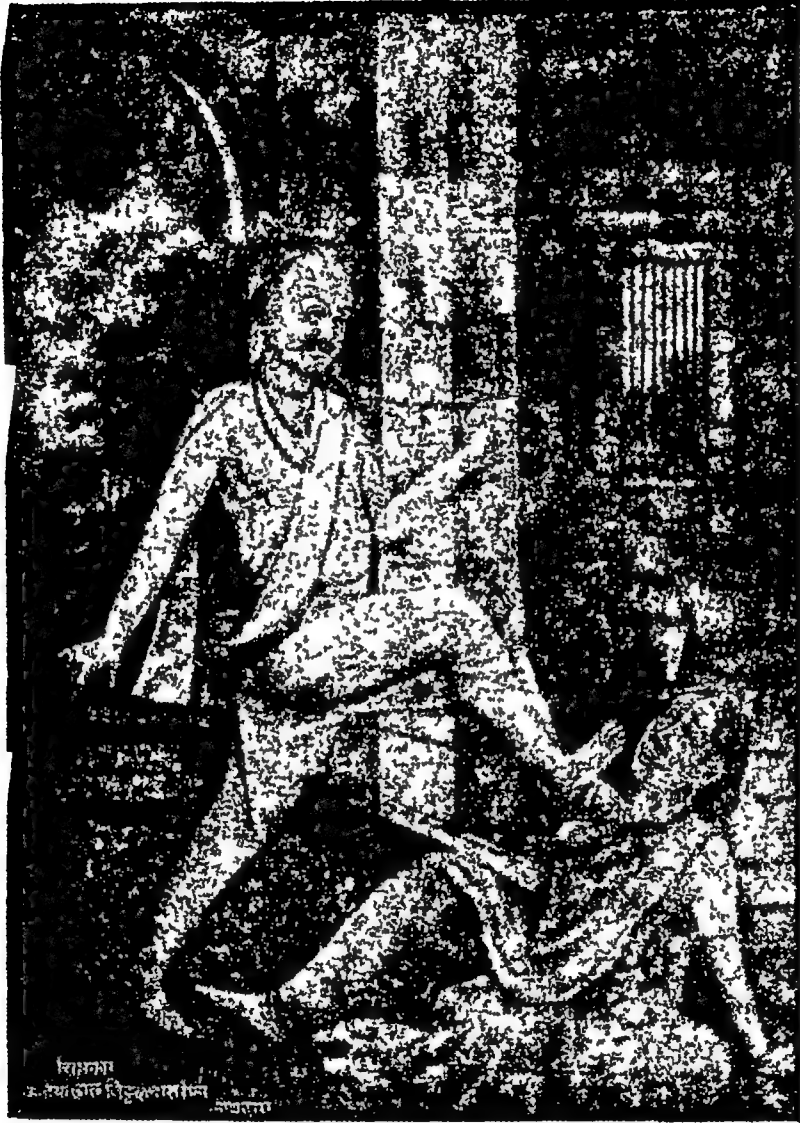
सुकुमाल मुनि का जीव ब्राह्मण के पूर्व भव में भौजाई को लात मारते हुए ।